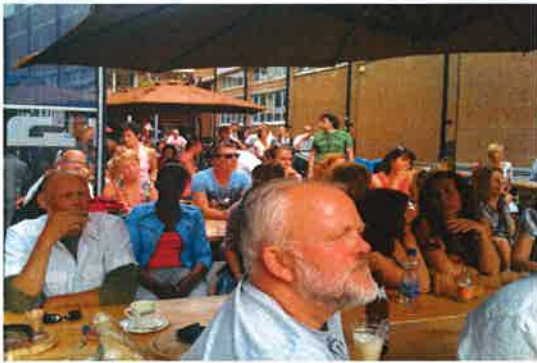
Publiek tijdens een terrasconcert

Het café groeit uit naar een belangrijke pijler in het programma van Gigant. Zowel filmtheater- als popzaal activiteiten worden ontwikkeld en ondersteund in het café..