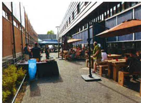
Nieuwe steeg met terras, doeken, band en BBQ