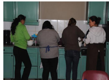
Vele huishoudelijke klussen in en om het huis.