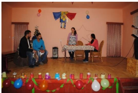
Educatielessen geven aan scholen en het jaarlijks kersttoneel.