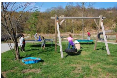
De speeltuin op de kinderboerderij en activiteiten tijdens de excursies.