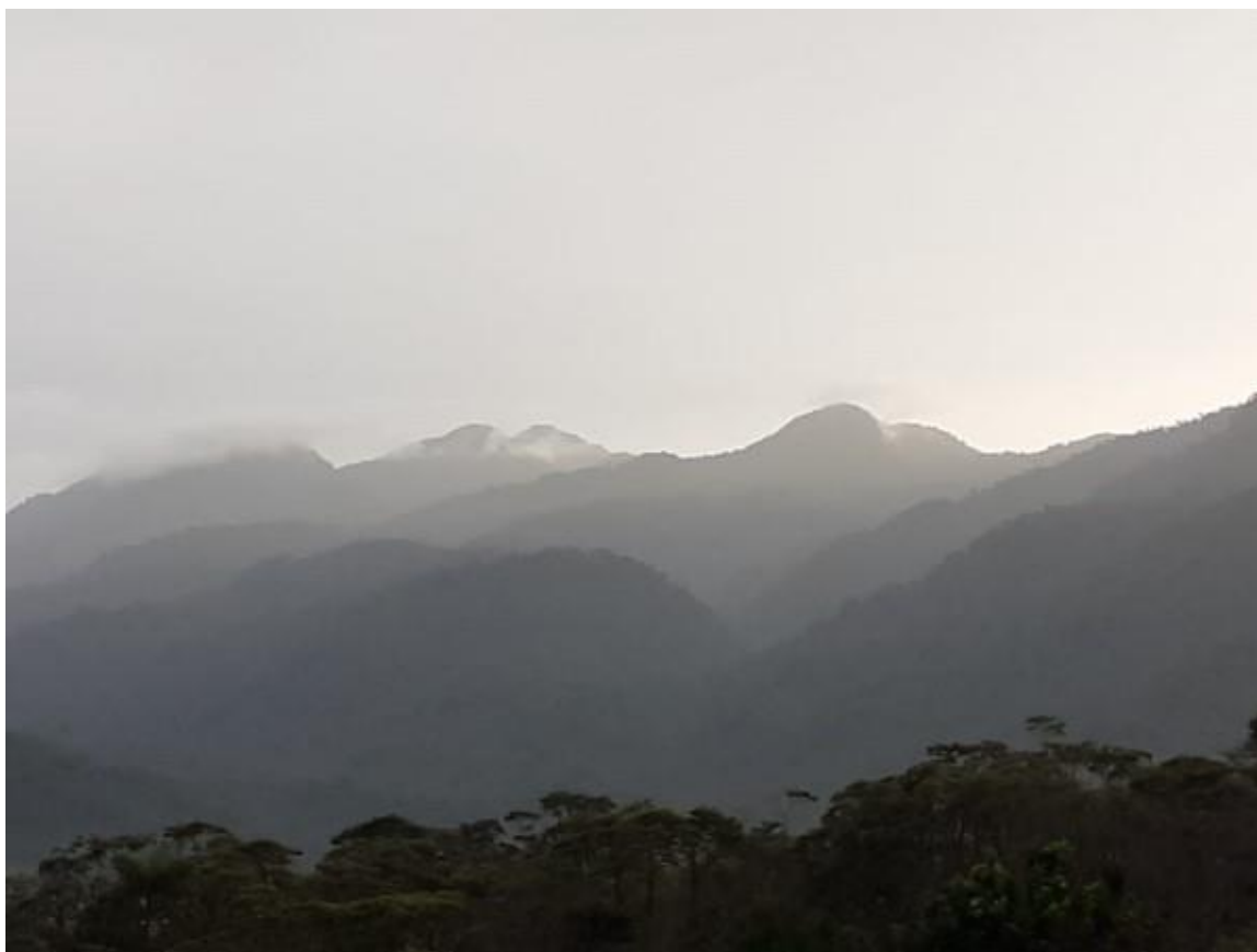
Het nationale park Llananates beschermt het reservaat van Merazonia 'in de rug'.

Pagina 11: Beoogde resultaten en middelen