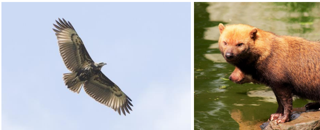
Twee zeldzame dieren, de solitaire arend en de bushdog, zijn in 2020 gespot in Merazonia.

Dit moet op de lange termijn, samen met doorlopende educatieve projecten leiden tot een groei van nieuwe bronnen van werkgelegenheid (ecotoerisme, wetenschappelijke studies) in de regio en zo ook de boskap en jacht verminderen.