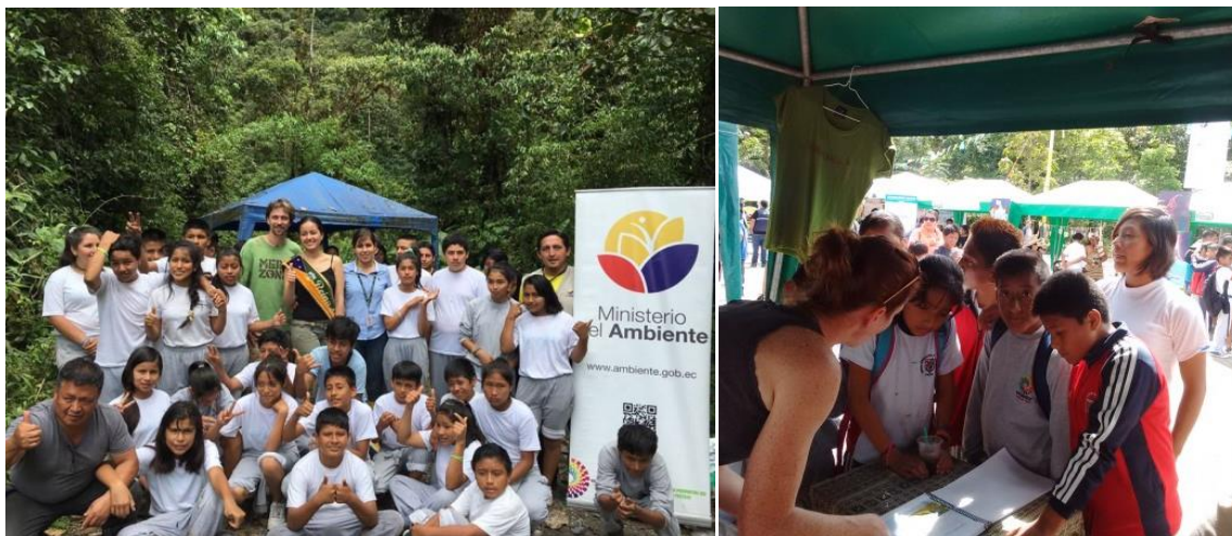
Merazonia neemt vaak deel aan educatieve projecten maar gaat ze nu ook zelf starten.

Een lang gekoesterde wens van Merazonia is het opzetten van een langlopend onderwijsprogramma in Ecuador, gericht op de regionale jeugd. In dit programma moeten thema's als het belang van natuurbehoud verenigd worden met het trainen van jongeren in vaardigheden die een alternatieve inkomstenbron bieden voor de jacht en houtkap. Iets waar nu nog veel mensen in de regio noodgedwongen geld mee proberen te verdienen.