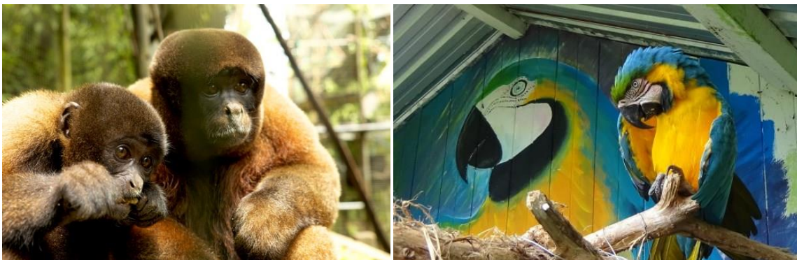
Merazonia huist veel verschillende diersoorten die allemaal hun eigen diëtaire eisen hebben.

De covidpandemie van 2020 heeft zand in die motor gestrooid en ook voor 2021 voorziet het centrum een afname aan vrijwilligers. Daarom zal de stichting op korte termijn bijspringen als er een tekort dreigt bij de financiering van de basisvoorzieningen en renovaties en eventueel ook bijdragen aan de bouw van een nieuw onderkomen. De stichting garandeert zo de stabiliteit en continuïteit van het centrum in geval van nood.