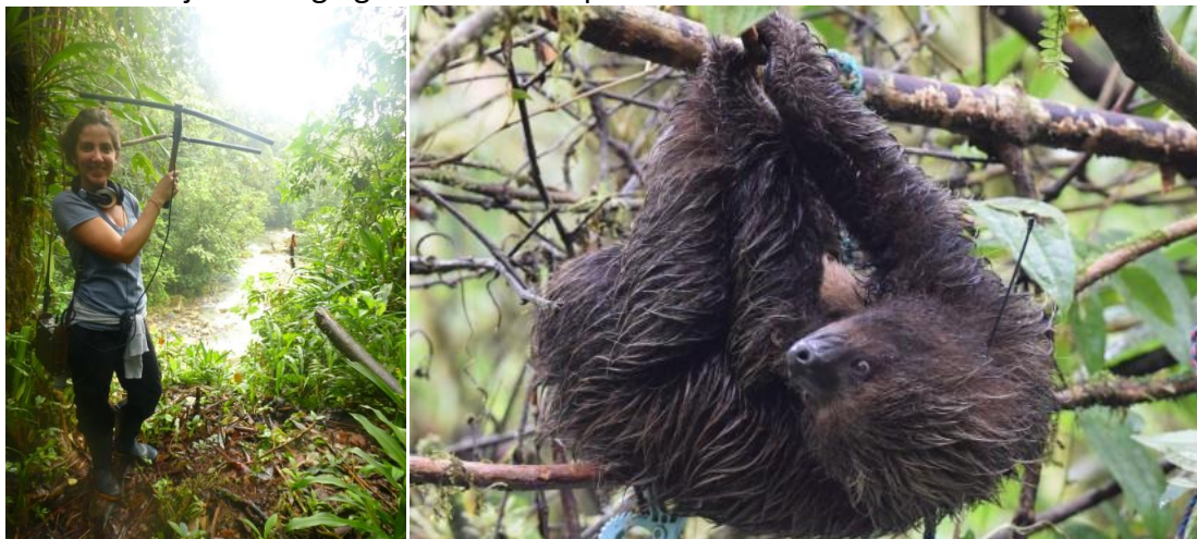
Met VHF trackers kunnen dieren ook na vrijlating gevolgd worden, zoals hier luiaard Stevie.

Hiermee samenhangend volgt een investering in het volgen van gerehabiliteerde dieren, post release , door middel van trapcamera's en GPS en VHF trackers. Het volgen van dieren na vrijlating heeft twee functies: 1) om eventueel in te kunnen grijpen als dieren in de problemen raken 2) het verzamelen van wetenschappelijk interessante informatie over natuurlijke bewegings- en activiteitspatronen van wilde dieren.