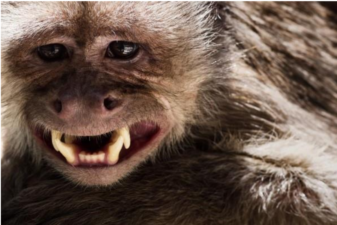
Capucijneraapjes zijn enorm intelligent en vergen veel aandacht en zorg om gezond te blijven.