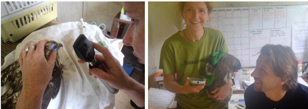
Medische apparatuur is kostbaar en van vitaal belang voor de verzorging van de dieren.

Dit kan in de vorm van het aanstellen van een extra bestuurslid, maar ook middels raadgevers op vlakken als financiën, fondsenwerving en dierenwelzijn. Zoals eerder gemeld wil het bestuur ook meer vrijwilligers betrekken bij de organisatie en concrete inzamelingsacties ontwikkelen en starten waarvan een deel jaarlijks herhaald kan worden.