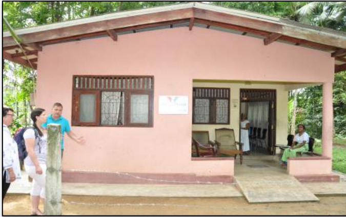
Medi-Aid House, verpleeghuisje van Medi-Aid dat plaats biedt aan 8 verpleegbehoefteige ouderen