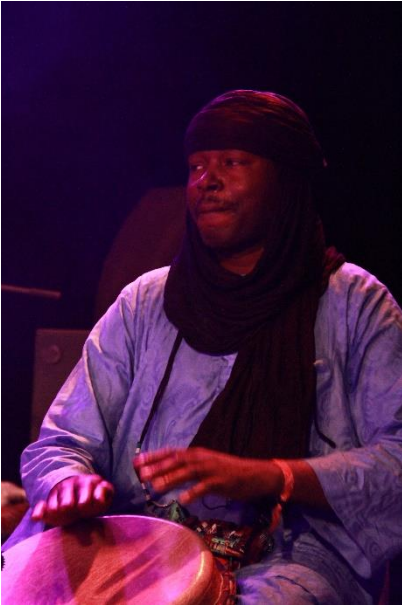
Tijdens het concert van Bombino in Tilburg

Beste vrienden, donateurs van Aman-Iman,