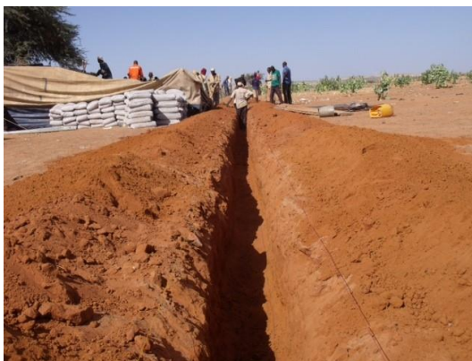
Aanleg van de waterleidingen naar de dorpen

Voor een volledige projectplan en het evaluatierapporten kijk op onze website www.aman-iman.nl , onder het kopje projecten – waterinstallatie.