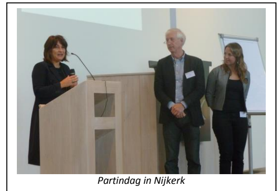
Partindag in Nijkerk