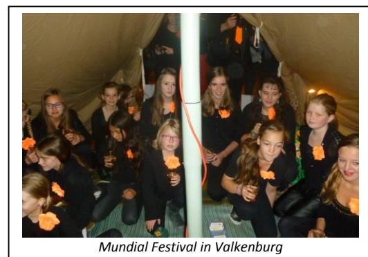
Mundial Festival in Valkenburg