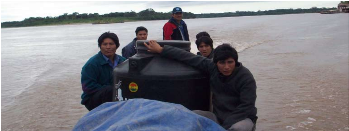
Watertank wordt van Rurrenabaque naar San Luis Grande vervoerd.

In 2009-2010 ondersteunde Amazon Fund de aanleg van een drinkwater systeem voor de inheemse Mosestén gemeenschap van San Luis Grande in het Pilon Lajas National Park. Na afronding van dit project diende de inheemse raad van het gebied (CTRM) een nieuwe aanvraag in voor ondersteuning van de aanleg van acht andere kleine drinkwater systemen in inheemse gemeenschappen langs de Quiquibey rivier in het Pilon Lajas Park. Een indicatief projectvoorstel opgesteld met de CTRM als de beoogde partnerorganisatie.