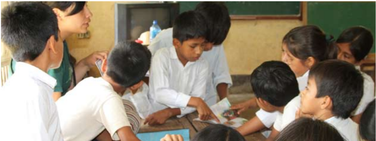
Schooltje in San Miguel.

Het natuur- en milieueducatie project is het resultaat van een initiatief uit 2008 dat heeft geleid tot de oprichting van de stichting Amazon Fund. Doel van het project is bij te dragen aan het verbeteren van milieubewustzijn en het omgaan met natuur en milieu onder schoolkinderen in Rurrenabaque, een stad in het Amazonegebied van Bolivia dat voor zijn economie afhankelijk is van ecotoerisme en de natuurlijke hulpbronnen in het omringende bosgebied. Onderliggende gedachte is dat goed omgaan met het milieu iets is dat je niet vroeg genoeg kunt leren. Het gaat om het leren met en in de natuur zelf, via het maken van schooltuintjes met Amazone gewassen en fruitbomen op de basisscholen en praktisch natuuronderwijs voor middelbare scholen met veldwerk in het tropisch regenwoud, onder leiding van inheemse Tacana gidsen.