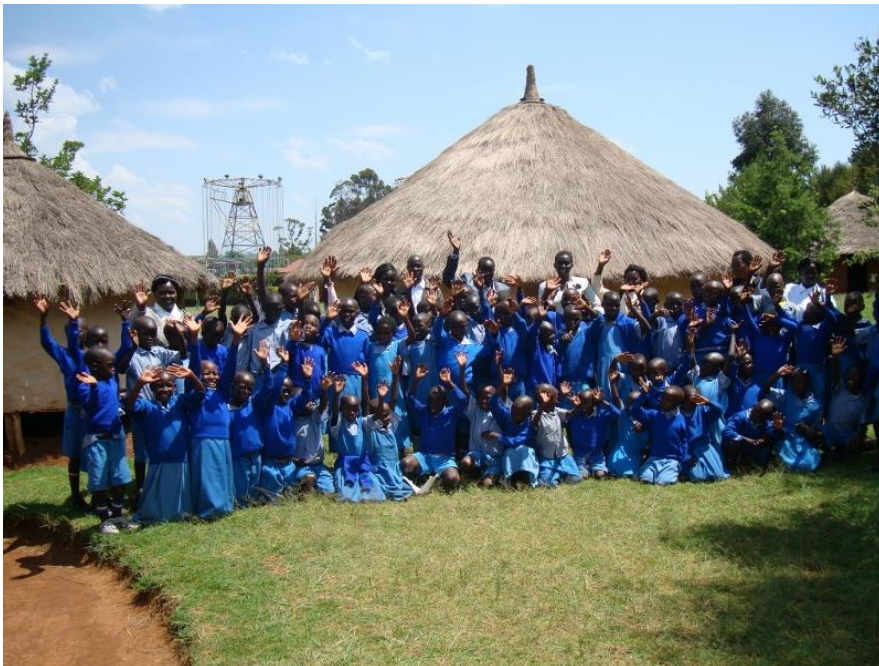
De leerlingen en docenten van Kolol tijdens een schoolreisje (georganiseerd en betaald door Kibet4Kids)

Kibet4Kids is eind 2013 begonnen met het project 'Kolol primary school'. Als het goed is heeft u destijds van ons een document ontvangen met uitleg over Kibet4Kids, onze missie, visie en redenen voor het ondersteunen van Kolol Primary School in Kenia – dit is ook terug te vinden op onze website. We zullen daar op deze plaats niet weer uitgebreid op ingaan. Wel zullen we, na een inleidend hoofdstuk met gegevens over de school, kort herhalen welke doelstellingen we hadden voor dit jaar en wat onze begroting was. Vervolgens gaan we stap voor stap na op welke wijze we onze doelstellingen hebben verwezenlijkt, wat daarbij goed ging en wat de knelpunten waren. Het project als geheel wordt samengevat onder Conclusies en aanbevelingen. Als laatste hebben we nog een hoofdstuk media toegevoegd. Hierin geven we aan op welke wijze wij aan promotie hebben gedaan en onze donateurs op de hoogte hebben gehouden.