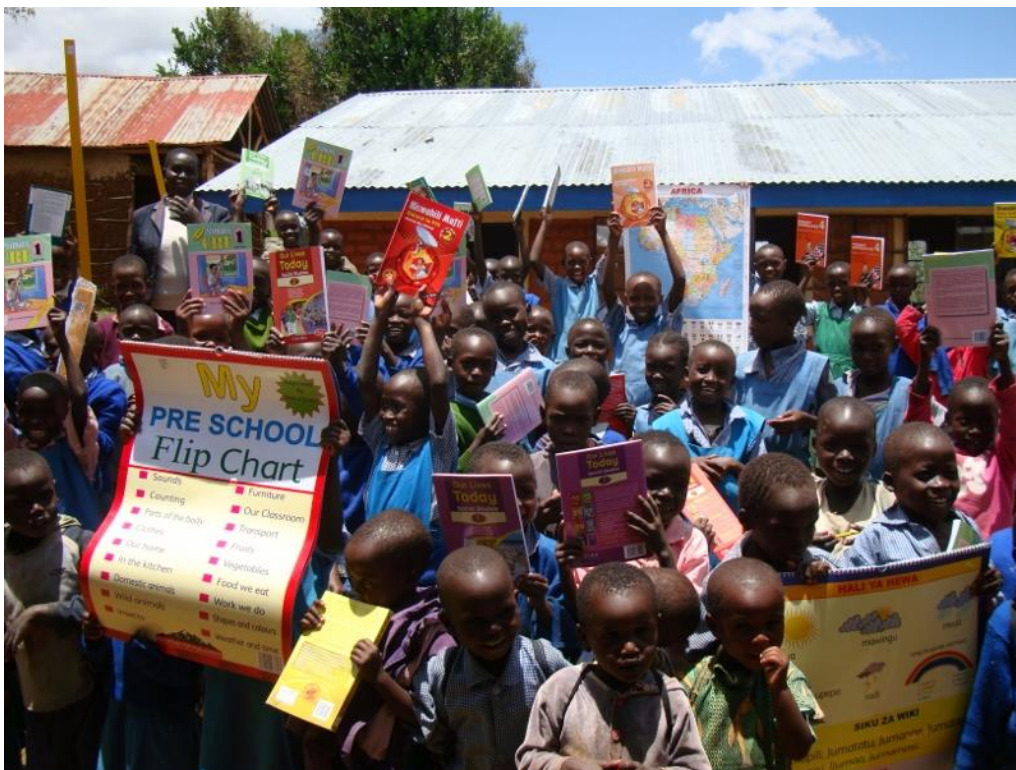
Leerlingen van Kolol met een deel van het studiemateriaal.

Begin maart ging onze secretaris, samen met 2 docenten van Kolol, naar de stad Eldoret om alle boeken en overig studiemateriaal te kopen. Dit kostte in totaal 192.500 Ksh (circa 1.700 euro). De spullen werden direkt meegenomen naar de school, opgeslagen in de docentenkamer en in gebruik genomen. Alle boeken werden ‘verpakt’ door een extra omslag van doorzichtig plastic, zodat ze langer in goede staat blijven.