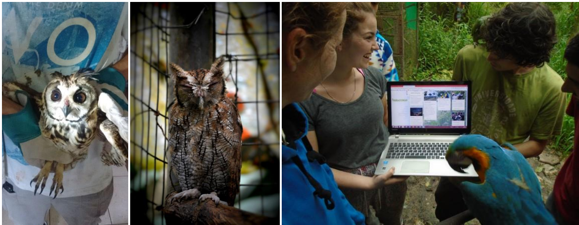
Twee verschillende uilsoorten zijn succesvol gerehabiliteerd en vrijgelaten met behulp van fondsen van de Stichting Merazonia. De nieuwe website is inmiddels ook online en heeft de goedkeuring van Malcolm de ara.

Een van de belangrijkste vernieuwingen die de stichting bekostigd heeft, is het moderniseren van de website. Voorheen werd deze gemaakt en onderhouden door (oud)vrijwilligers. Hoewel dit kosten bespaarde, bracht het ook problemen met zich mee omdat de website moeilijk toegankelijk was voor de leiding van Merazonia en ook sterk verouderd was. De oude site was bijvoorbeeld niet responsive , oftewel ongeschikt voor het gebruik op smartphones.