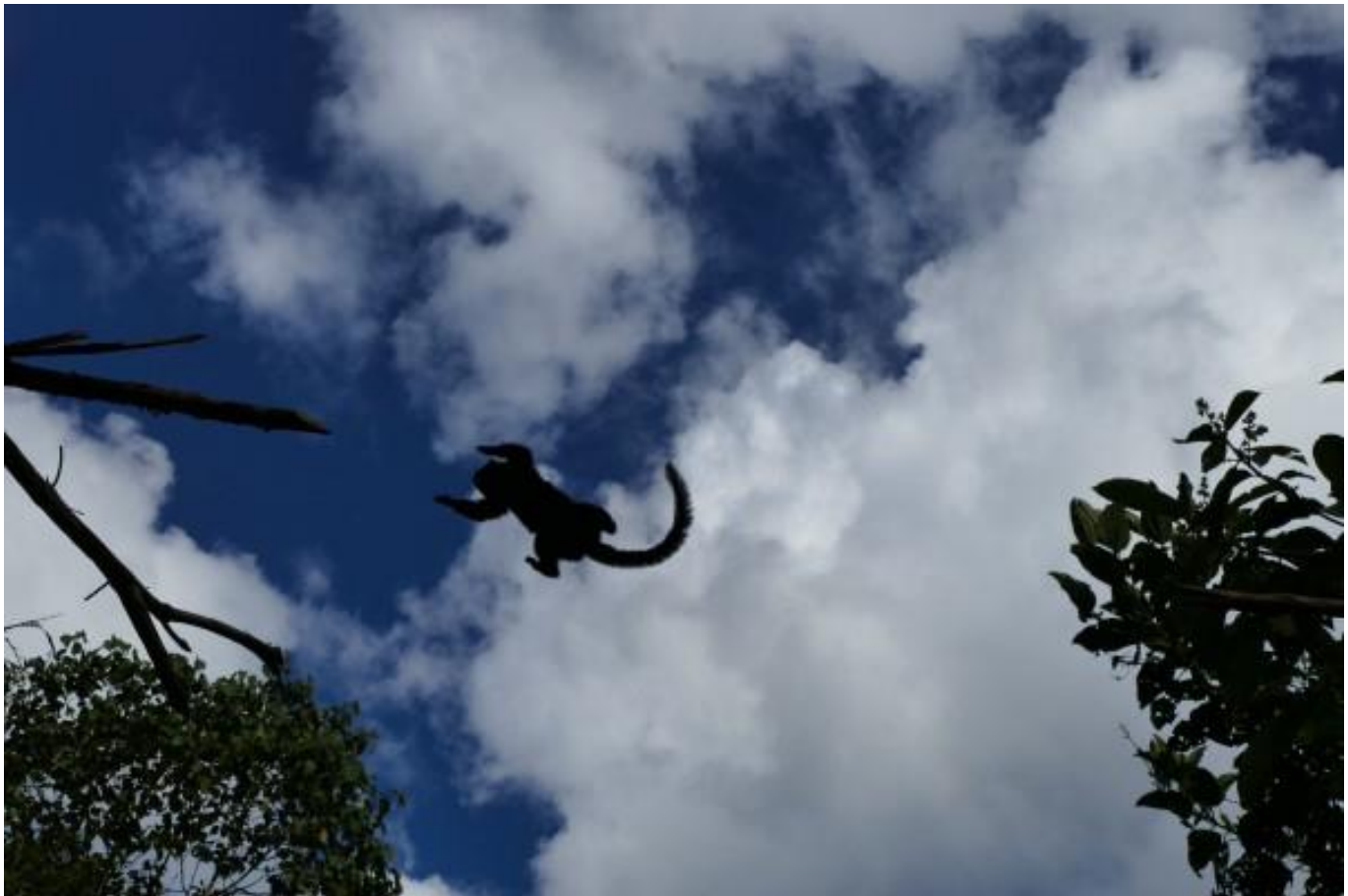
Een aapje van een vrije groep tamarins 'vliegt' door de bomen van het Merazoniareservaat.