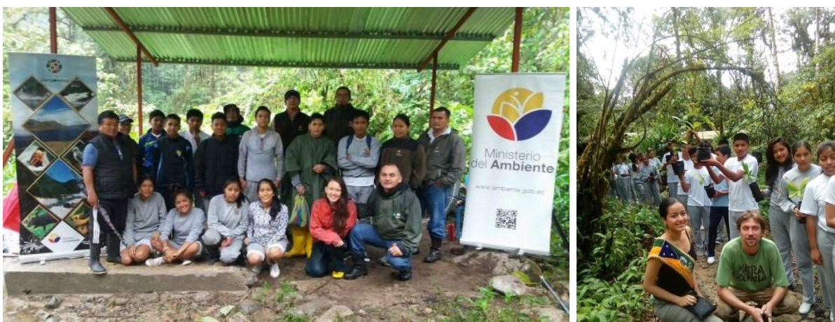
In samenwerking met het Ministerie van Milieu, ontvangt Merazonia geregeld schoolgroepen voor educationele projecten. Een nieuw dak voor de ontvangstruimte was nodig nadat er een boom was gevallen op de oude plek.

Verder heeft de stichting enkele renovaties en verbeteringen van dierenverblijven betaald, zoals de grote volière voor aras en het wolapenverblijf. En er is er een nieuw dak gemaakt voor de algemene ontvangstruimte.