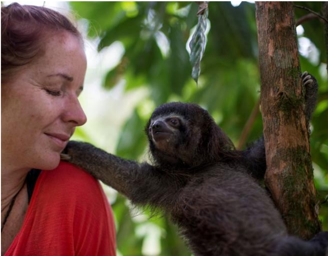
Jonge dieren hebben aanvankelijk vertrouwen en hulp nodig van mensen om hun natuurlijke talenten en overlevingsinstincten te ontwikkelen. Deze jonge drietenige luiaard is in 2017 na bijna een jaar zorg en training, met een radiozender vrijgelaten binnen het Merazoniareservaat.

Het zal onmogelijk zijn om al deze projecten in 2018 tot uitvoer te brengen. Maar we hopen met een aantal te beginnen en af te ronden. Zoals ook vorig jaar vermeld, zullen door het toenemend aantal dieren in het dieren centrum en de inflatie in Ecuador, de vaste kosten ook in het komende jaar weer toenemen. Indien nodig zal de stichting bijspringen om deze basiskosten te dekken.