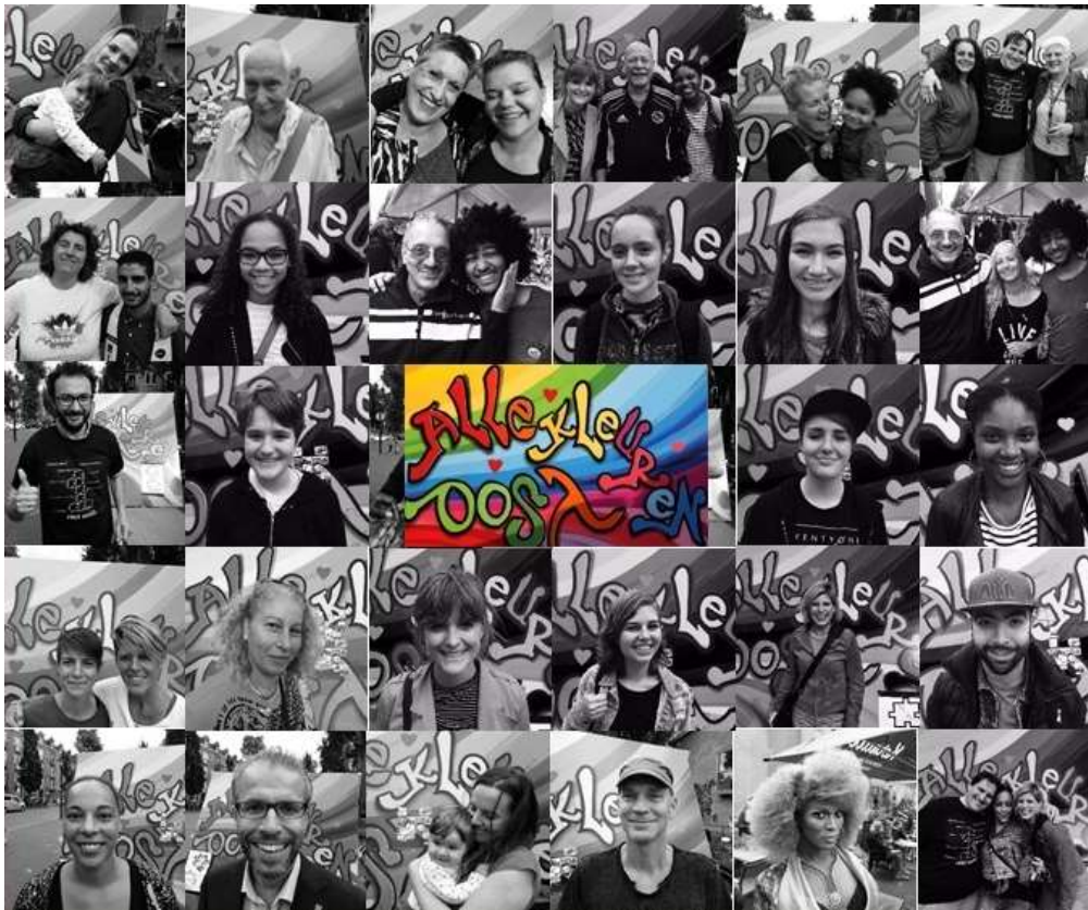
Pride Oost – 3 augustus 2016

Javaplein Indische Buurt, Amsterdam Oost