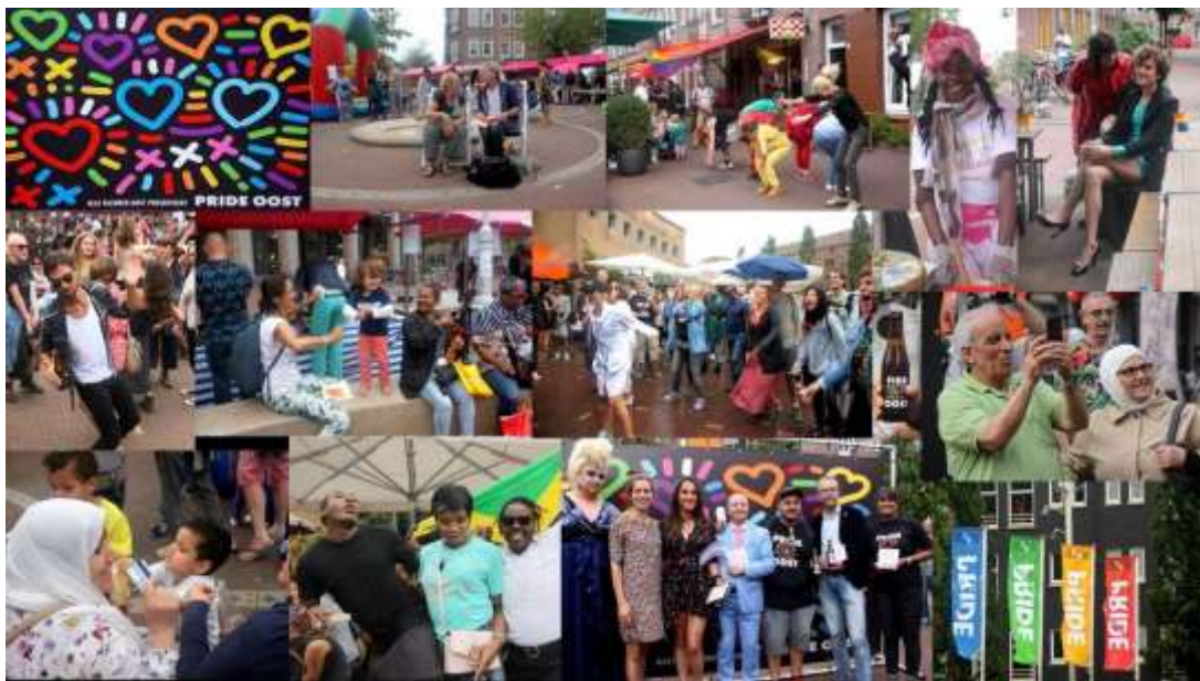
Pride Oost – 2 augustus 2017

Javaplein Indische Buurt, Amsterdam Oost