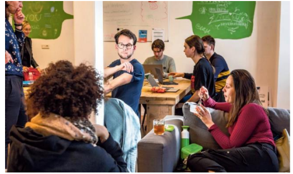
Vrijwilligers in Maastricht

In 2020 blijft @ease Maastricht een goedbezochte locatie. Met name (internationale) studenten weten ons te vinden. Door onze aanwezigheid op middelbare scholen zien we ook steeds meer scholieren. Vanwege COVID-19 en de bijhorende lockdown, waren we helaas fysiek gesloten van 15 maart tot en met 15 juni. Als alternatief voor de gesprekken op locatie werd vanuit Maastricht de online chat van @ease opgezet en uitgerold naar de andere vestigingen. In deze periode voerden we telefonisch ook ruim 71 gesprekken met jongeren.