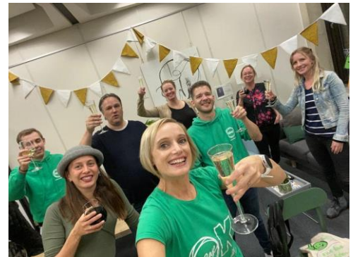
Feestelijke opening @ease Heerlen

In het oude CBS-gebouw, pal naast het Centraal Station in Heerlen, is sinds een aantal jaren Carbon6 gevestigd. Carbon6 is een broedplaats van ruim 130 startups en kleine bedrijven. In dit pand huurt @ease een woonkamer en 2 spreekkamers. In Heerlen werd er begin januari hard gewerkt aan de inrichting van onze drie ruimtes, zodat we op 23 januari 2020 voor het eerst onze deuren voor jongeren konden openen. Helaas, vlak nadat op deze locatie het eerste gesprek gevoerd werd, ging het land in algehele lockdown. Locatie Heerlen sloot haar deuren van 15 maart tot en met 15 juni. De vrijwilligers van Heerlen werden tijdens deze periode ook ingezet op de chat.