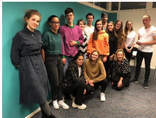
De eerste groep vrijwilligers in Rotterdam

Woensdag 14 oktober 2020 heeft @ease Rotterdam haar deuren geopend met 8 actieve vrijwilligers en een viertal professional-vrijwilligers. Op deze locatie hebben we (nog) geen betaalde medewerkers. In Rotterdam is @ease opgezet via een samenwerking met het Centrum voor Jeugd en Gezin (CJG) Rijnmond . De huidige locatie, waarbij we inhuizen bij het CJG in de Centrale Bibliotheek Rotterdam (Hoogstraat 10) is geschikt om jongeren op een laagdrempelige en anonieme manier te kunnen ontvangen. Wekelijks is de locatie geopend op de woensdag van 15.30 tot 19.30 uur.