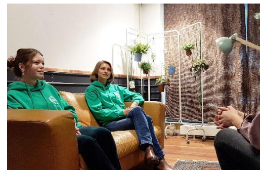
Vrijwilligers in Amsterdam

Door de coronacrisis konden we jongeren tijdelijk niet fysiek ontvangen; we hebben echter wel veel telefonische en online gesprekken gehad. In de tweede helft van het jaar zijn bovendien aanzienlijk meer jongeren binnengelopen dan de jaren daarvoor. Gemiddeld 2 jongeren per middag dat we open waren.