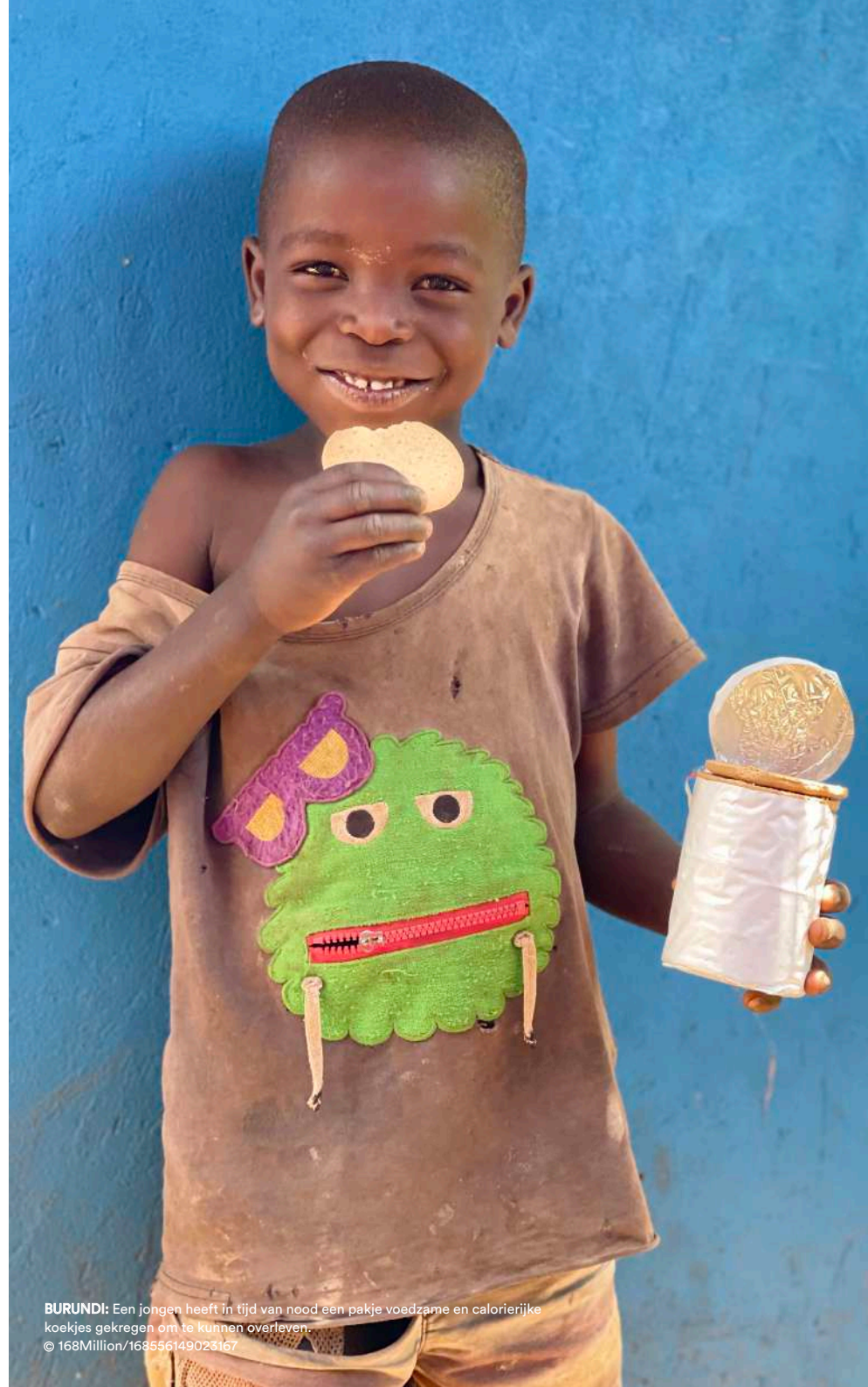
BURUNDI: Een jongen heeft in tijd van nood een pakje voedzame en calorierijke koekjes gekregen om te kunnen overleven.