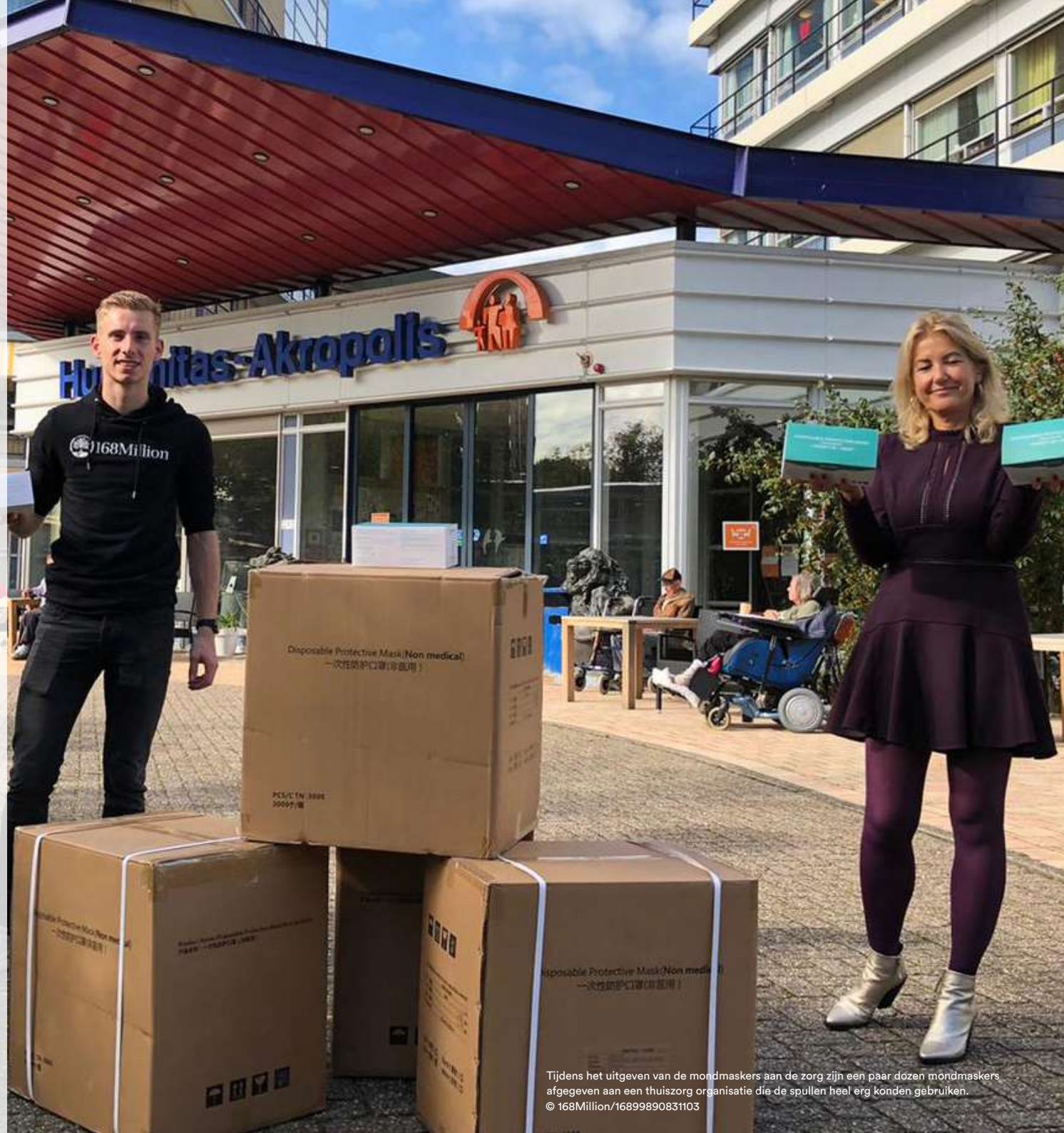
Tijdens het uitgeven van de mondkapjes aan de zorg zijn een paar dozen mondkapjes afgegeven aan een thuiszorg organisatie die de spullen heel erg konden gebruiken.

FFP2 maskers zijn in principe gemaakt voor eenmalig gebruik. In een context van belangrijke schaarste, heeft het RIVM in Nederland een richtlijn gepubliceerd voor het hergebruik van FFP2 maskers. De Nederlandse vakbonden eisten van het RIVM een aanpassing van de richtlijn voor het gebruik van beschermde maskers door zorgpersoneel. Ze eisten van het RIVM de richtlijnen te veranderen in preventief gebruik van FFP2-maskers door alle zorgmedewerkers, ongeacht de setting en de handelingen die uitgevoerd worden.