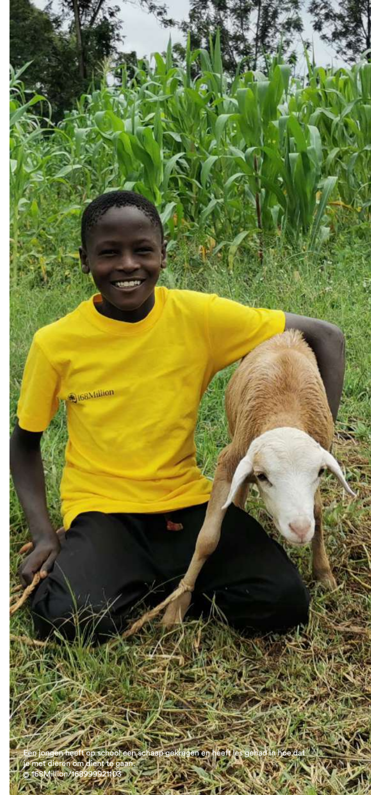
Een jongen heeft op school een schaap gekregen en heeft les gehad in hoe dat je met dieren om dient te gaan.