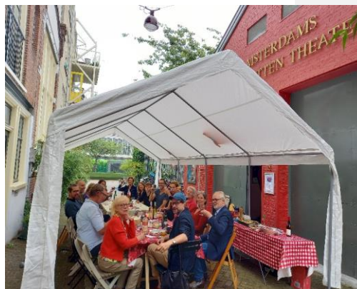
buurt bbq, zomer 2021