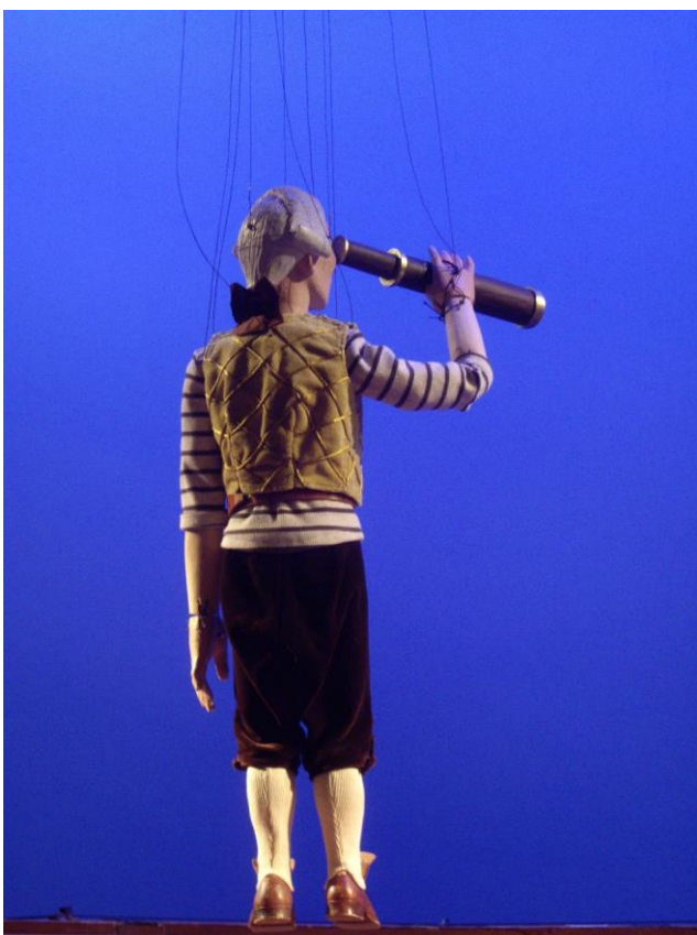
stuurman, De Vliegende Hollander

De blik is gericht op volgend jaar: voor 2022 hopen we op een uitbundiger theaterjaar.