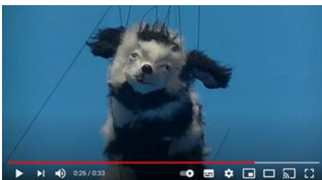
'corona-puppie' door Abbas Jafari, voorjaar 2021

Tijdens de twee bizarre covid-jaren was er veel ruimte om nieuwe talenten te ontdekken en aan te wenden. Zo werd er in kleine groepen gebrainstormd over het vervolg van onze Anderhalve Meter Editie , waarbij veel creatieve ideeën en praktische oplossingen werden aangedragen. Op het atelier werd een 'corona-puppie' geboren – post covid in te zetten bij backstage programma's . En er kon gelukkig – ook tijdens de periodes waarin geen publiek kon worden ontvangen – gestaag worden doorgewerkt aan onze nieuwe productie De Vliegende Hollander .