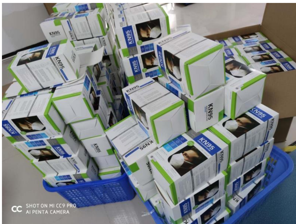
10000 mondkapjes gedoneerd aan ziekenhuizen in 2020

2021 aangeleverd en verspreid in de gemeente Ngwa-Ukwu. We zijn ervan overtuigd dat zonder energievoorziening geen enkele economie in de wereld zich verder kan ontwikkelen. Daarom investeert de stichting Ray of Light in projecten die helpen met het verbeteren van de economie, gezondheid en milieu. De kinderen en de dorpingen kunnen genieten van schone lucht, langer studeren en op de markt is er nu meer tijd om hun producten te verkopen zodat er minder weggegooid hoeft te worden. Activiteit Het doel van het Solar Energy project was om hernieuwbare energie toegankelijk te maken in de gemeente Ngwa-Ukwu op het platteland in de staat Abia, Nigeria. Er zijn in totaal 5000 solar-leeslampjes verspreid via de gemeente.