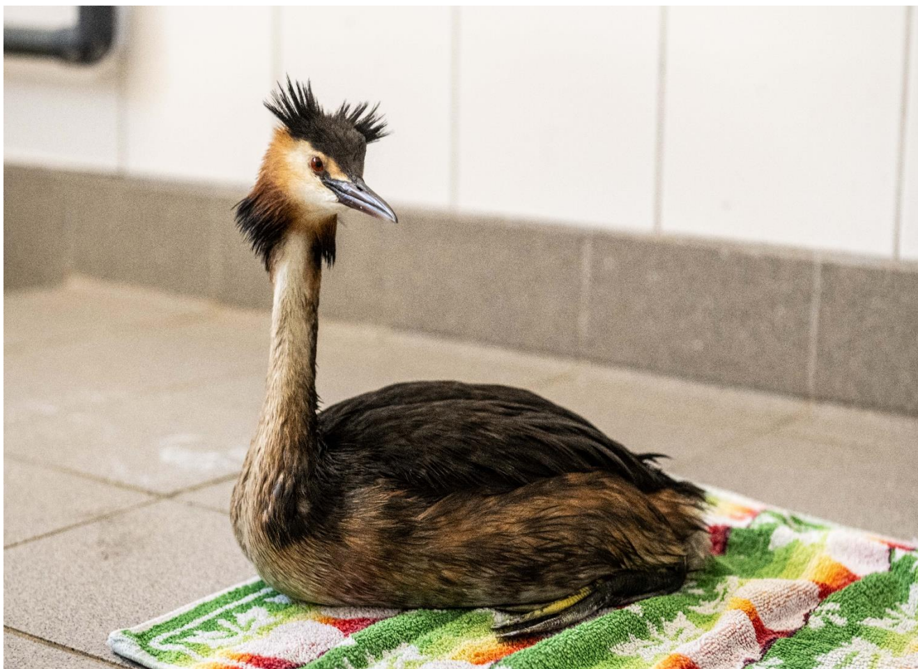
Fuutje in ons Badhuis