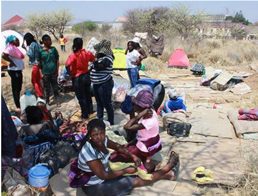
1,6 million Namibians living in poverty