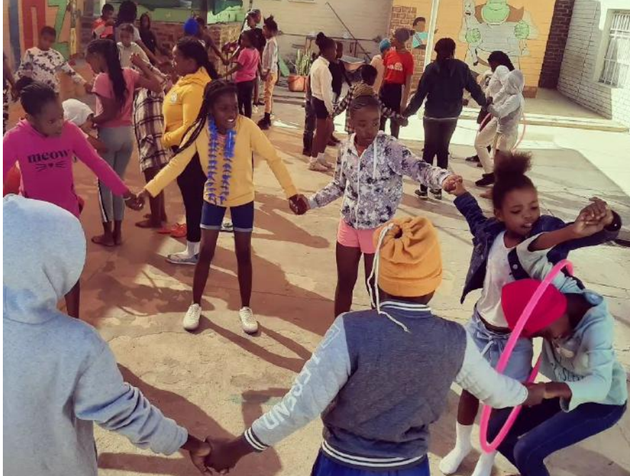
Laat je vangen door de hoepel