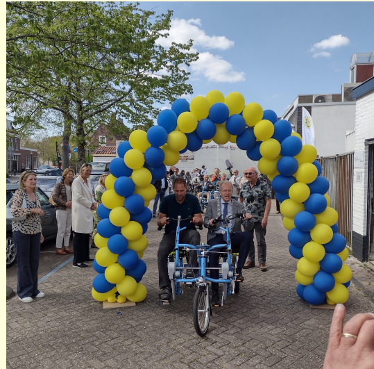
Bij Wassenaar: In gebruik name tweede duofiets met de burgemeester en avonturier Mark Slats.