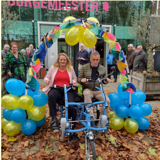
Bij Haarlemmermeer: start met wethouder