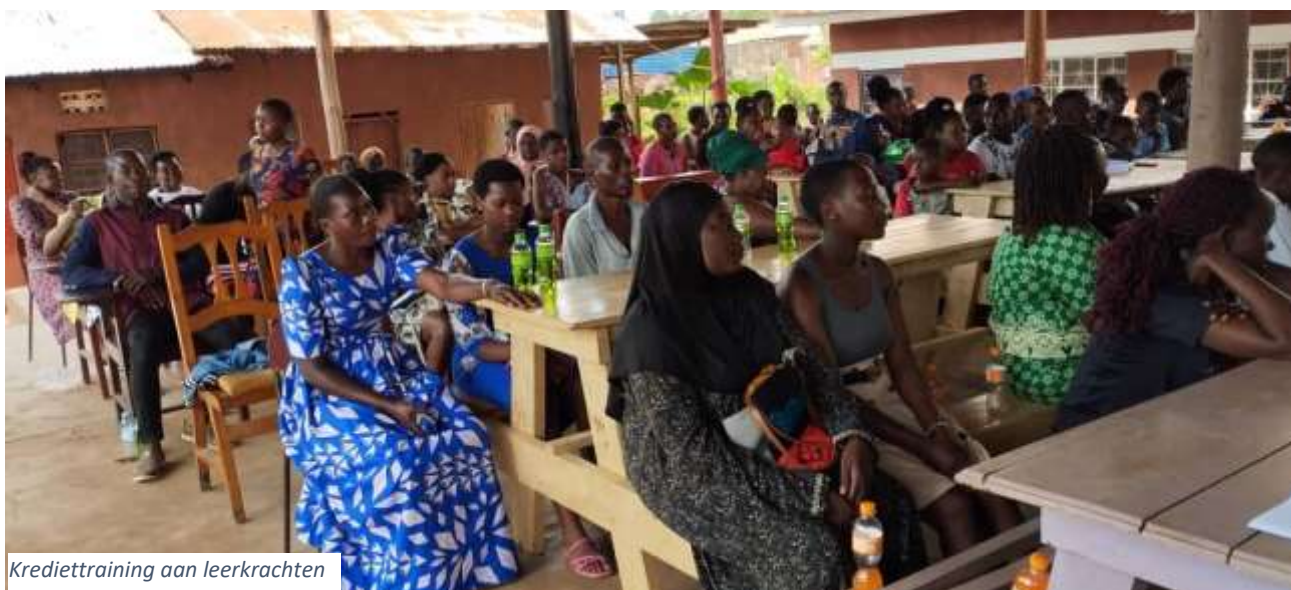
Krediettraining aan leerkrachten

Bedankt allemaal voor jullie giften, zeker onze trouwe donateurs; dit brengt ons al dichterbij het uiteindelijke doel. Het project ligt ter goedkeuring voor samenwerking bij de Wilde ganzen. Met nog een aantal acties denken we fase 1 van de gezondheidskliniek binnen een paar maanden al te kunnen financieren.