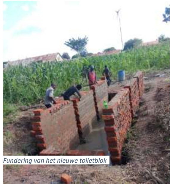
Fundering van het nieuwe toiletblok

Een paar weken geleden kregen we het verontrustende nieuws binnen van CFO in Alwa dat de school moest sluiten. Na een lange droogte ging het er aanhoudend regenen. Het land kon de regen niet opnemen waardoor er landslides ontstonden en huizen instortten. Bij de vakopleiding was het mannen toilettenblok ingestort. De jongens moesten hun behoefte tussen de struiken doen wat gezondheidsrisico's opleverde. De school besloot vervroegd examens af te nemen en zijn noodgedwongen twee weken eerder gesloten. Voor januari moet er weer een toiletblok staan wil de school opengaan. Wij hebben deze school kunnen voorzien in middelen om de wc's weer op te bouwen.